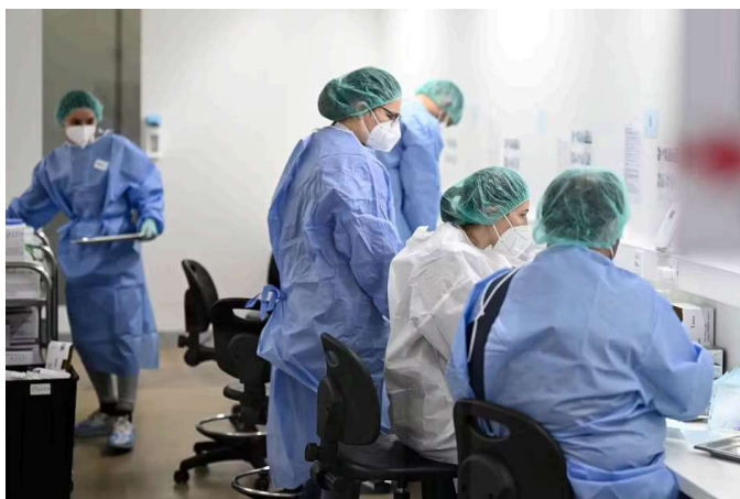
Ein Impfzentrum in Berlin