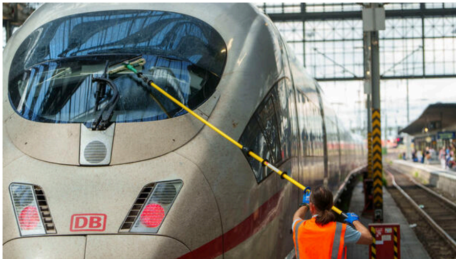
Die Deutsche Bahn investiert Milliarden in die Streckensanierung.

von Anabel Schröter 25. Juli 2024 , aktualisiert 25. Juli 2024, 17:37 Uhr