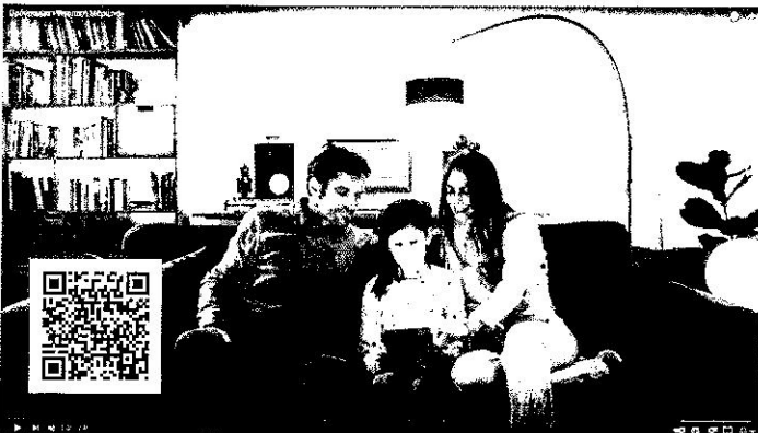
Die EU verschenkte 200 Euro für Tablets.

Griechenland hat im großen Stil 200-Euro-Gutscheine für Laptops, Tablets und PC's an Kinder, Studenten und Lehrer verschenkt. Das Subventionsprogramm und die Online-Antragsstelle wurden in einem Werbevideo landesweit beworben.