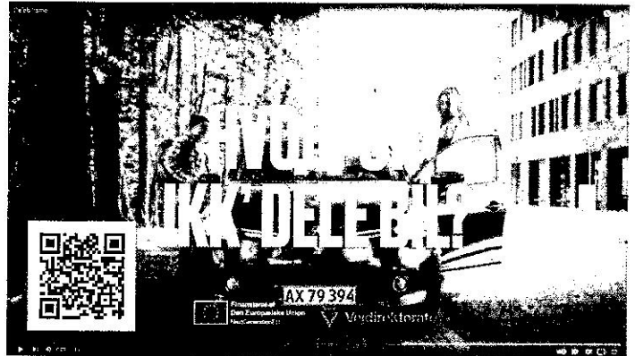
Dänemark finanziert Carsharing-Werbung mit EU-Kreditgeld.

Gleichzeitig war das reiche Dänemark aber auch smart genug, sich u. a. 400.000 Euro aus dem EU-Corona-Fonds schenken zu lassen, um damit eine Werbekampagne für das Car-Sharing zu finanzieren.