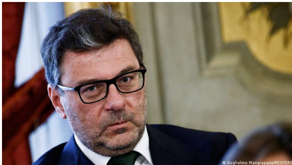
Italiens Finanzminister Giancarlo Giorgetti: Mehr Eigenverantwortung für die Verschuldeten

Deutschland sehe sich nicht alleine in der Rolle des Sparsamen, so Lindner. Italien und Frankreich, beide hochverschuldet, üben Kritik allerdings aus einer ganz anderen Richtung. Frankreichs Finanzminister Bruno Le Maire möchte die Klausel streichen, dass die Neuverschuldung jedes Jahr um 0,5 Prozent sinken muss, wenn sie über drei Prozent liegt. Diese Klausel steht auf deutschen Wunsch hin im Gesetzesvorschlag. Italiens Finanzminister Giancarlo Giorgetti liebäugelt mit einer "Goldenen Regel", nach der Schulden, die im Zusammenhang mit EU-Projekten gemacht werden, nicht auf die Staatsverschuldung angerechnet werden. Das sind im Falle Italiens etliche Milliarden, die zur Kofinanzierung von EU-Fördermaßnahmen aufgewendet werden müssen.