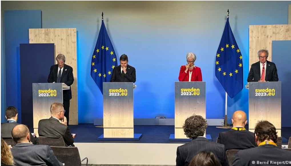
EU-Kommissar Gentiloni (1. v. li.) und die Präsidentin der Europäischen Zentralbank Lagarde (2.v.re.) raten zu weniger Staatsausgaben