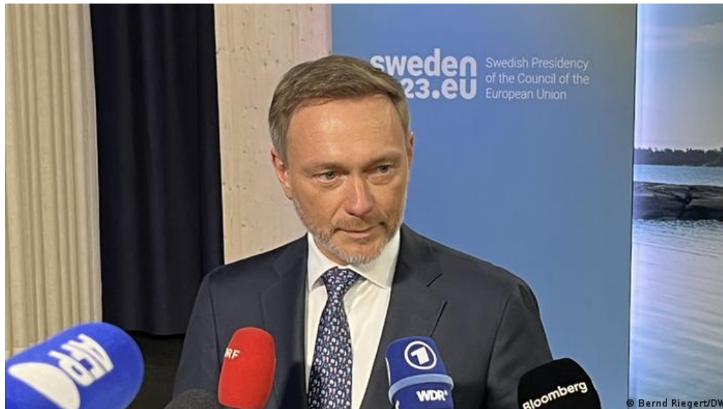
Finanzminister Christian Lindner: "Deutschland ist immer konstruktiv"

Die Europäische Kommission hat einen Vorschlag zur Reform der Schuldenregeln vorgelegt, der mehr Eigenverantwortung für die Schuldnerstaaten und weniger starre Vorgaben für den Schuldenabbau vorsieht. Investitionen in grüne Energie, Digitalisierung und Verteidigung sollen aus der Schuldenberechnung herausgenommen werden. Bundesfinanzminister Christian Lindner sind diese Regeln zu lasch , obwohl die EU-Kommission an den Grenzen von 60 Prozent Neuverschuldung und drei Prozent jährlichem Defizit festhält. "Wir haben keine klaren Vorgaben, was Zahlen angeht und deshalb auch keine Garantie, dass Schulden und Defizit wirklich zurückgehen", monierte Christian Lindner in Stockholm. Die EU-Kommission will mit jedem überschuldeten Land individuelle Ziele aushandeln. Für den deutschen Finanzminister kein gangbarer Weg. Die Staatsfinanzen würden so "politischem Belieben" ausgesetzt. "Es gibt gegenwärtig noch viel zu diskutieren."