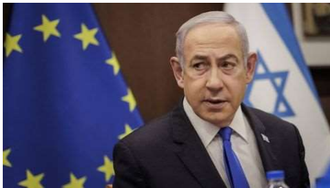
NAHOST Netanjahu, der Grabenkämpfer

Netanjahu hatte in einer am Dienstag veröffentlichten Videoansprache die US-Regierung wegen einer zurückgehaltenen Waffenlieferung mit harschen Worten angegriffen und damit für Irritation beim wichtigsten Verbündeten gesorgt. Er habe US-Außenminister Antony Blinken kürzlich in Israel gesagt, es sei "unbegreiflich", dass die Regierung Israel in den vergangenen Monaten Waffen und Munition vorenthalten habe, sagte Netanjahu in dem Clip.